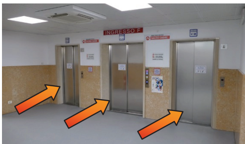
Ascensori per ingresso "T" (tamponi)

L'ingresso per effettuare i tamponi è il "T" e si trova sotto il tendone bianco.