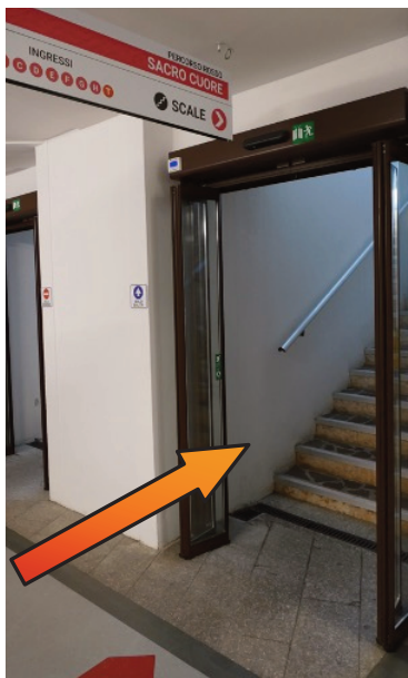
Scale per ingresso "T" (tamponi)

Prenda le scale che trova a metà corridoio o in alternativa gli ascensori in fondo al tunnel, premendo il tasto "0".